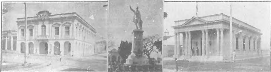
Palacio del Obispo