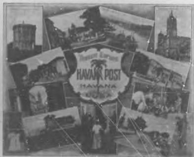
Portada del Album, publicado por "The Havana Post" por iniciativa de Mr. Bradt.