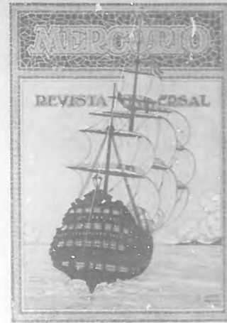
Fotografía de la portada del primer número de "Mercurio", debida á su director artístico y literario Mr. Branyas.

las vibraciones del éter, las quejas de las sombras, la alegría de la luz, la vida del sol; á la vez, que con la virtualidad de aquel arte sin cesar renovado por el ritmo, cual una aurora perpetua, como una melodía libre, generaba una aspiración más amplia hacia una vida más rica.