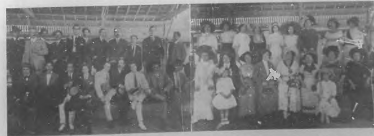
Artistas de la Compañía de Virginia Fabregas á su llegada de México. Fotografía hecha momentos después de desembarcar.