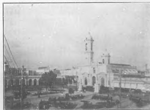
Cienfuegos, La Catedral